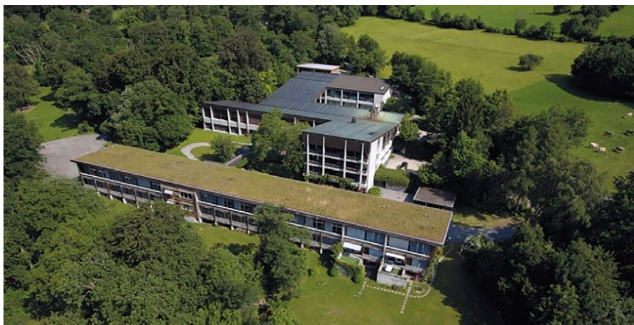
IBW:s universitet i Maienfeld. (Institut Für Berufliche Weiterbildung Graubünden)

Ett tydligt exempel på att vi måste förstå varandra och agera därefter fick vi under slutdagen. Vi hade en mycket intressant exkursion som handlade om hur man använder skogen i bergsområden där det finns stor risk för laviner men även för ras av stenblock och erosionsskador. Tidigare hade de beskrivit att cirka 40% av Schweiz produktiva skogsareal är skyddsskog och för de flesta av oss så var betydelsen fram till besöket i skogen att