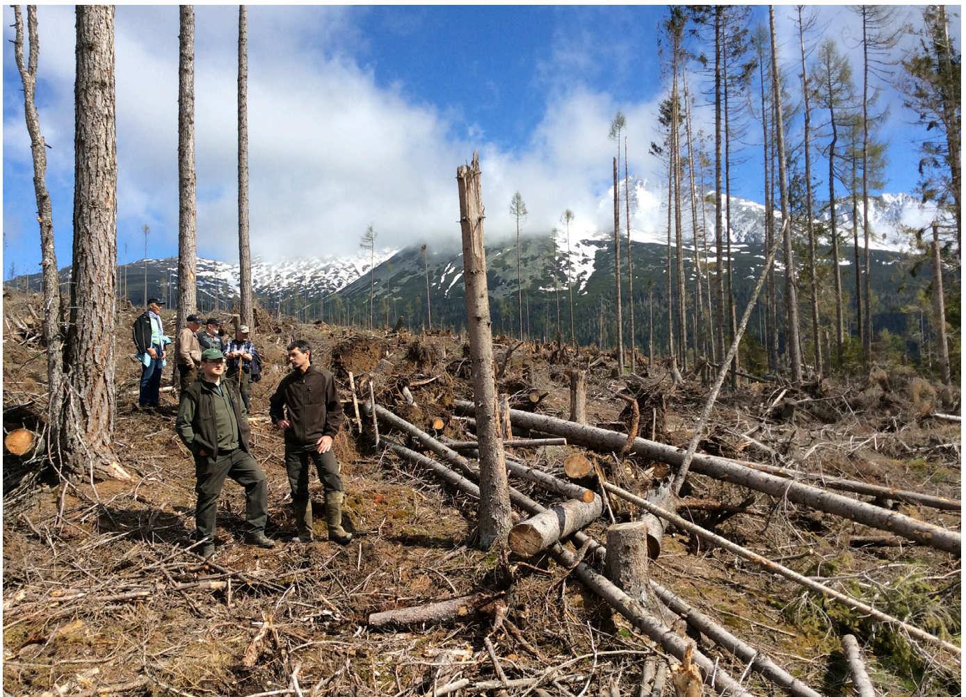
Tatrabergen, Slovakien, stormfälld skog