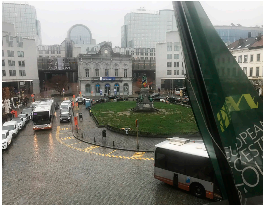
Utsikt över EU-parlamentet från skogens hus Bryssel

UEF anordnar "round table meeting" för parlamentariker i februari.